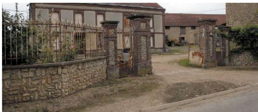
parcelle cadastrale n° 238