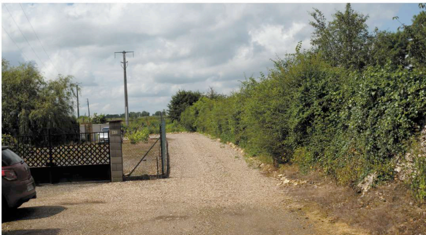
parcelle cadastrale n° 97