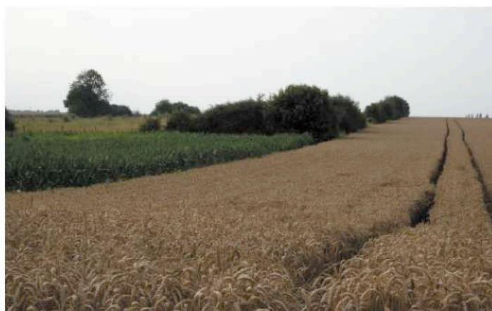
parcelle cadastrale n° 34