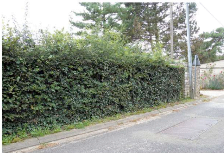
parcelle cadastrale n° 240