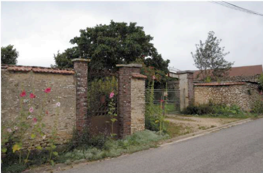
parcelle cadastrale n° 116