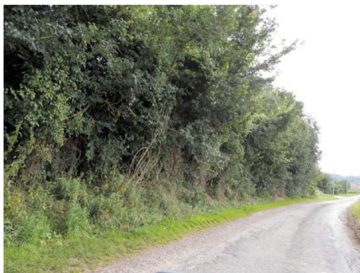
parcelle cadastrale n° 47