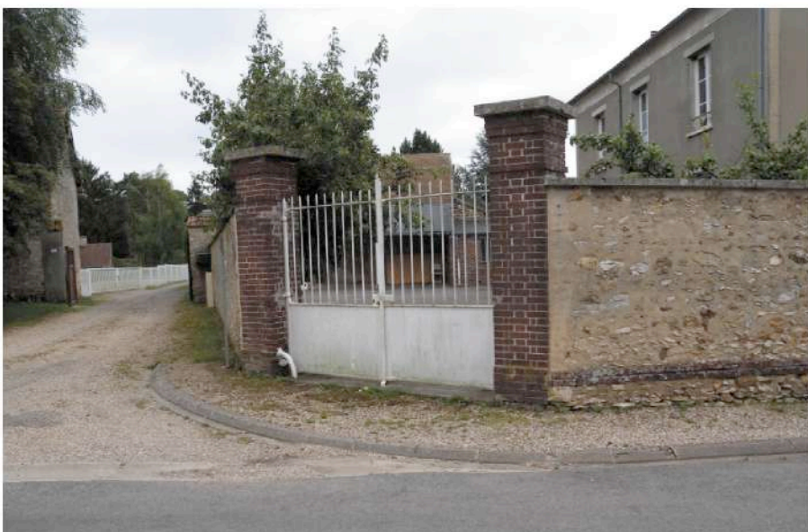
parcelle cadastrale n° 35