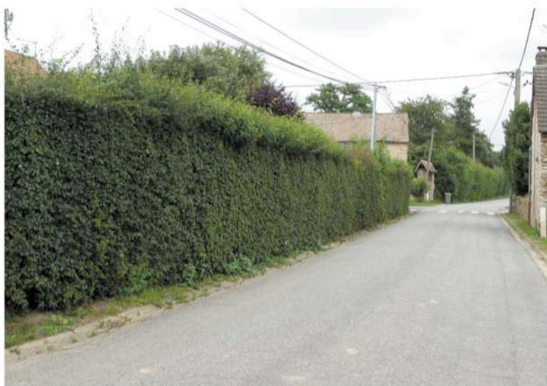
parcelle cadastrale n° 109