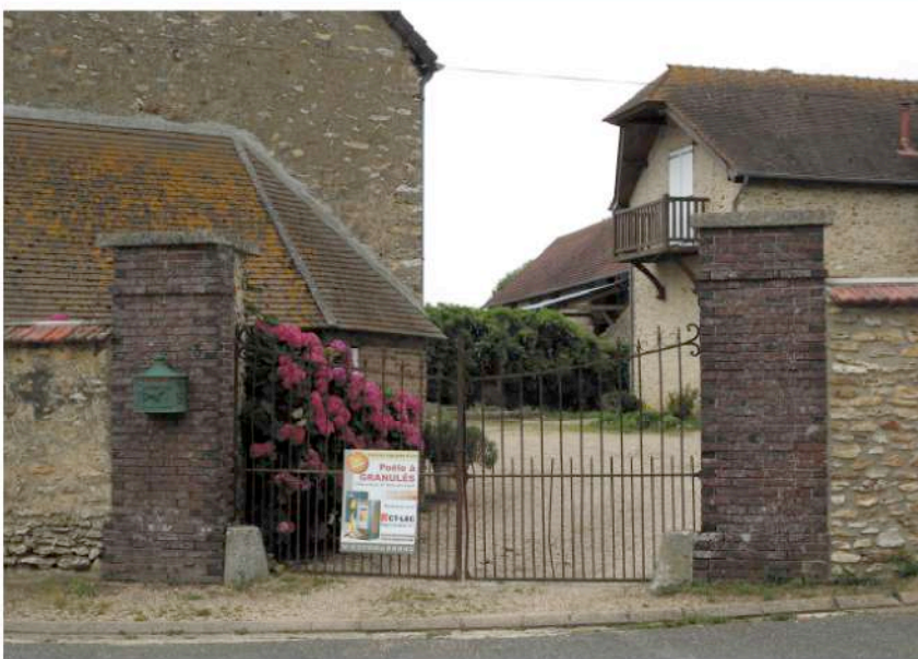
parcelle cadastrale n° 74