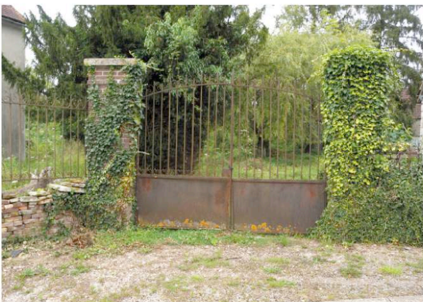
parcelle cadastrale n° 39