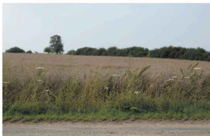
parcelle cadastrale n° 32