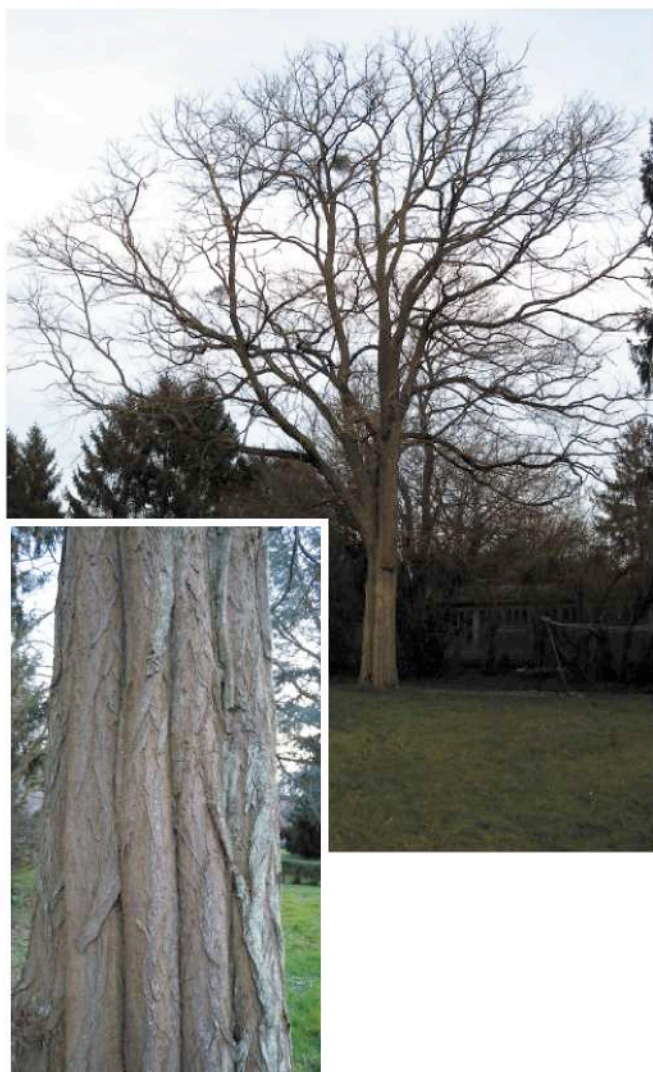
parcelle cadastrale n° 38