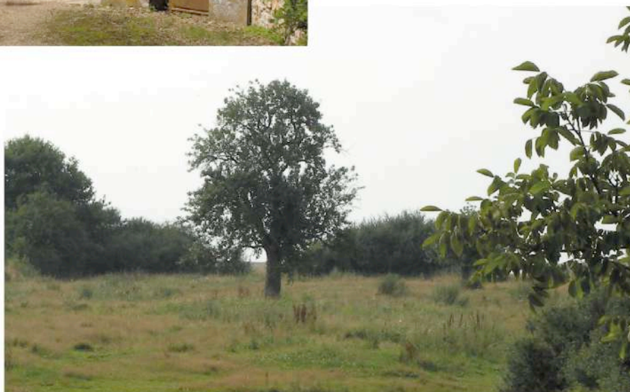
parcelle cadastrale n° 76