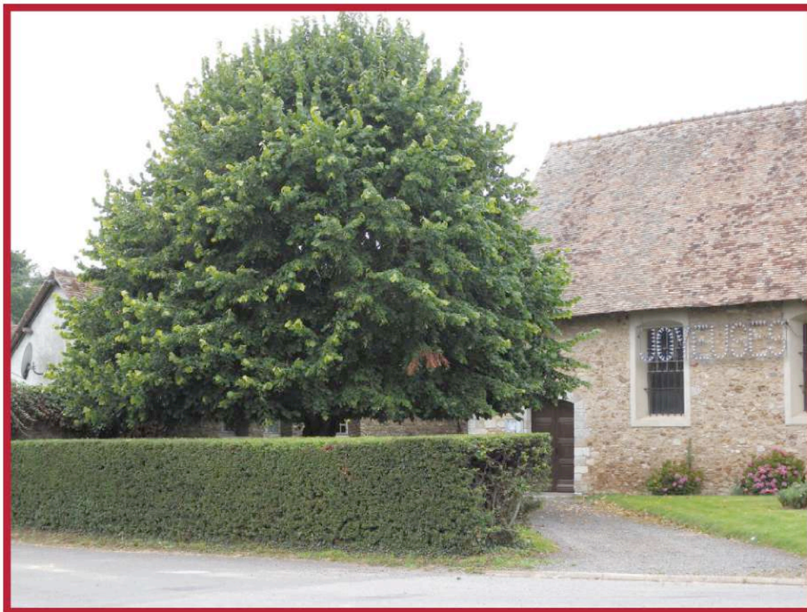
parcelle cadastrale n° 120