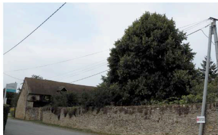
parcelle cadastrale n° 10