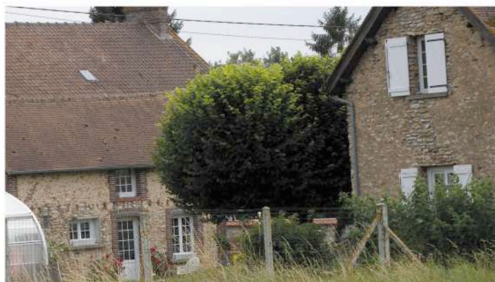
parcelle cadastrale n° 74