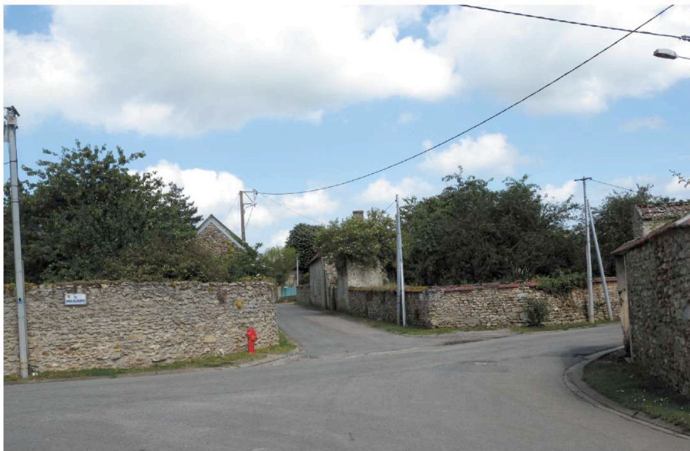
parcelle cadastrale n° 223