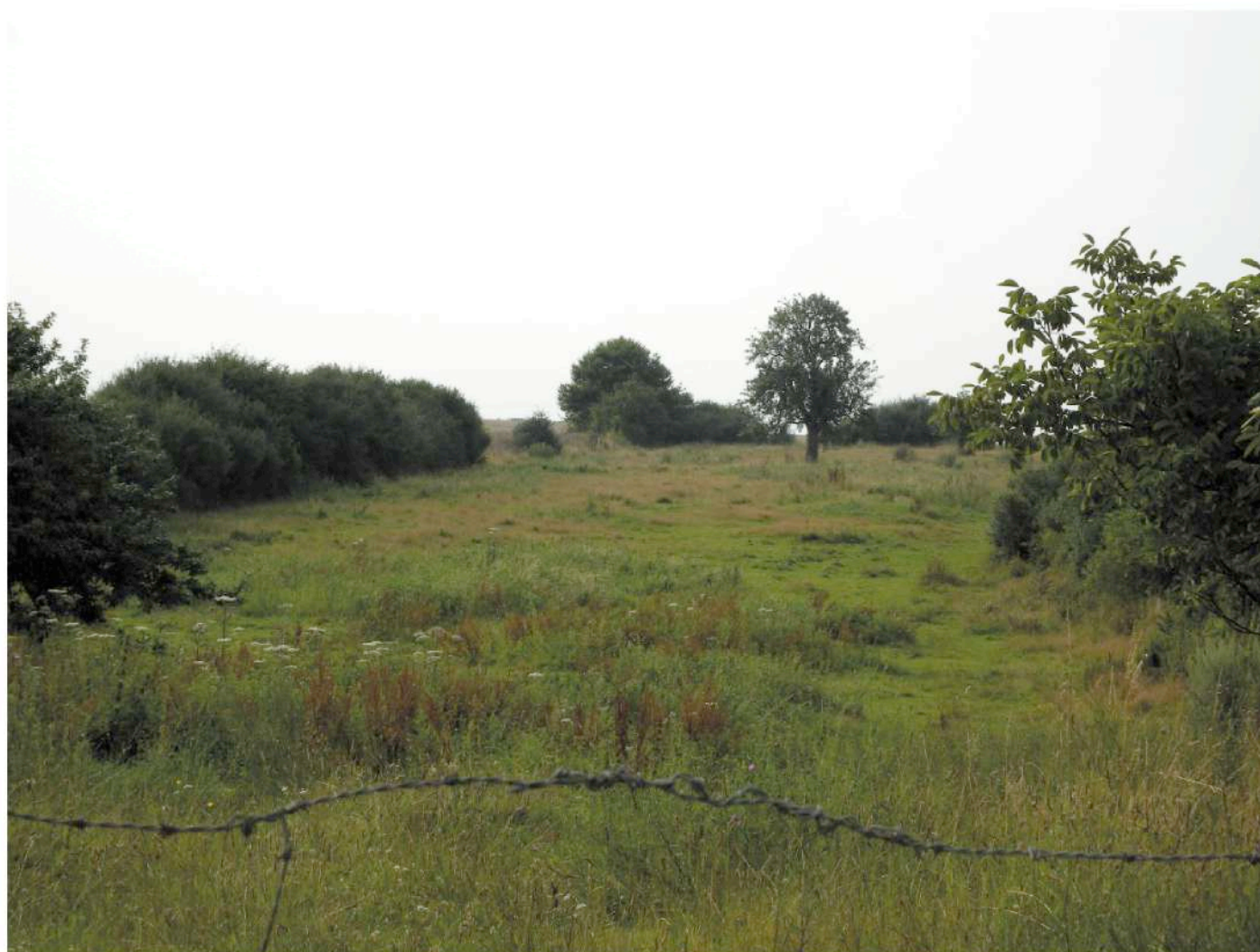
parcelle cadastrale n° 76