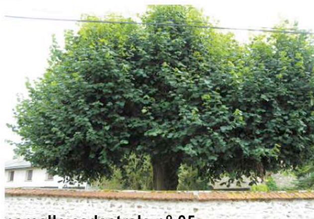
parcelle cadastrale n° 95