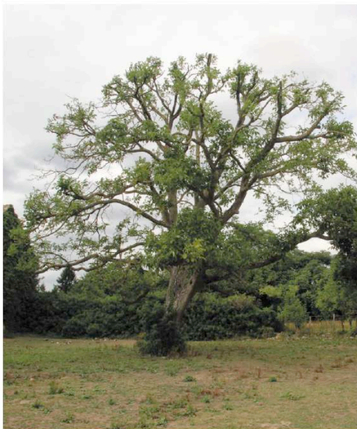
parcelle cadastrale n° 110