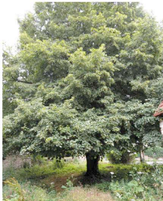
parcelle cadastrale n° 39