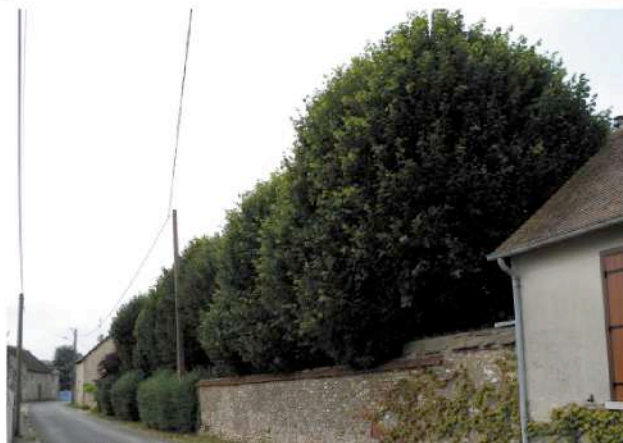
parcelle cadastrale n° 38