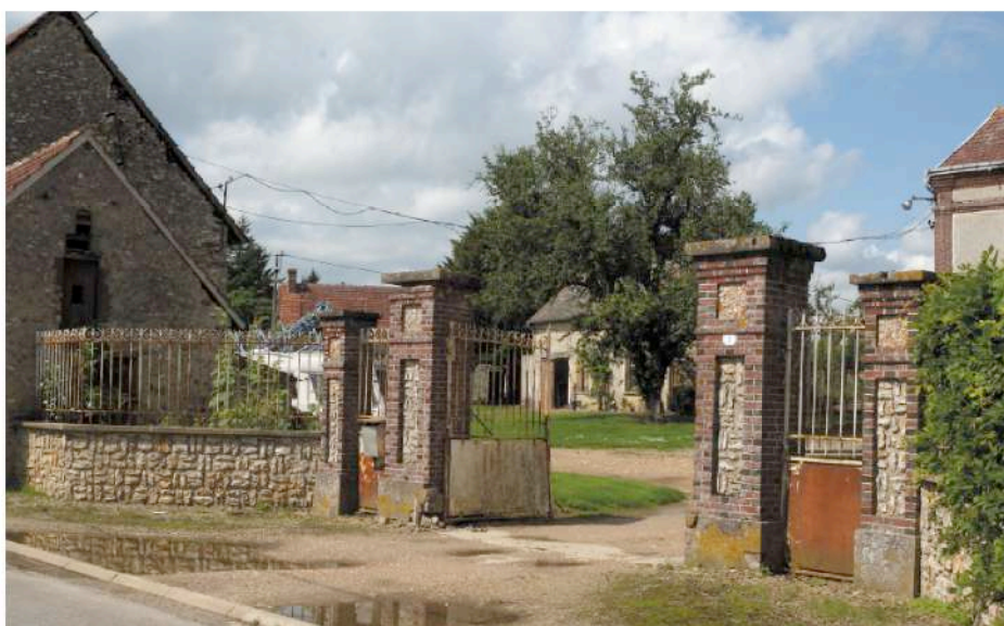
parcelle cadastrale n° 220