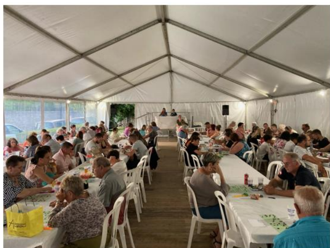
Fête de la St Jean_ LOTO